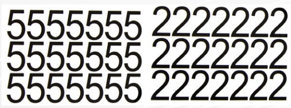
Caracteres para Reflestickter.