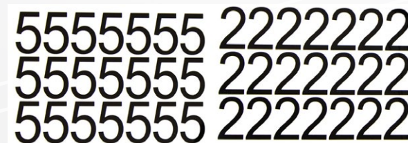
Caracteres para Reflestickter.