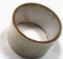
Cinta transportadora de caracteres.